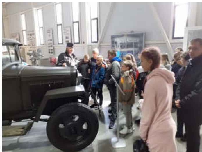
Фото едущих по льду Ладоги грузовиков и регулирующих движение людей с флажками знакомы многим. Казалось бы — зачем там регулировщики? С конца ноября начались необычайно сильные морозы, они достигали -51 градуса по Цельсию. Дул свирепый северный ветер, метель заметала дорогу. В этих условиях водители часто теряли ориентировку. А немцы дорогу постоянно бомбили. Воронки после попадания бомб быстро затягивало тонким льдом и засыпало снегом, водителям они были не видны, и машины постоянно проваливались под лёд. Только за первую зимнюю неделю было потеряно 150 автомобилей с

грузами. И именно для указания мест воронок нужны были регулировщики. Ежедневно на льду озера дежурило до 1000 человек. Водители часто ездили без дверей и без кабин — это помогало уменьшить массу знаменитых «полуторок».